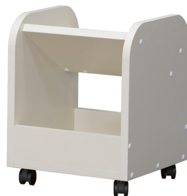
イーロッカー ※送料別

下段にはランドセル以外の持ち物も収納でき、登下校などの持ち物準備が自分でできるようにサポートします。